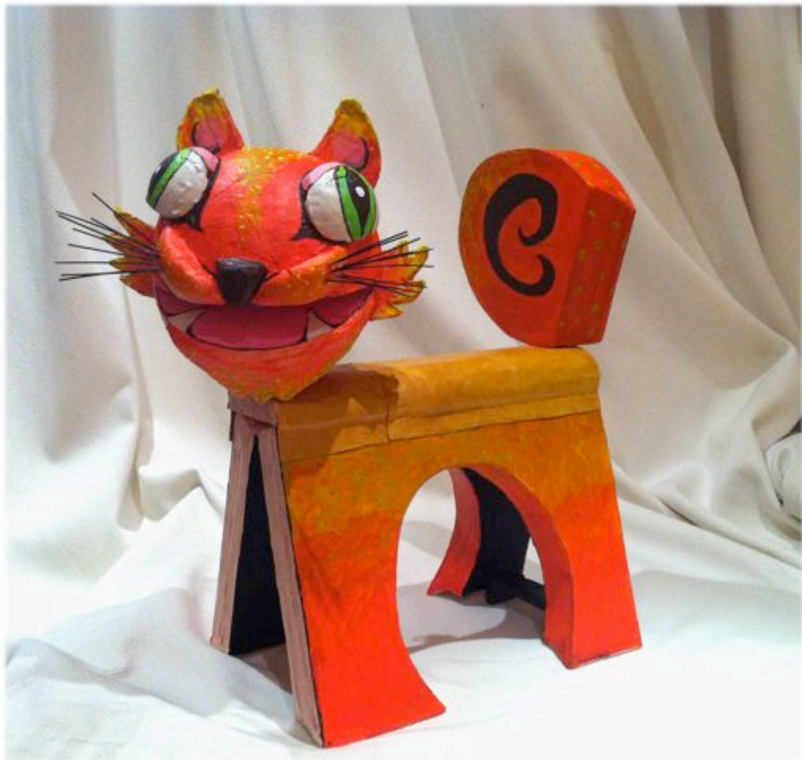
LOS LIBROS SE CONVIERTEN EN PERSONAJES.