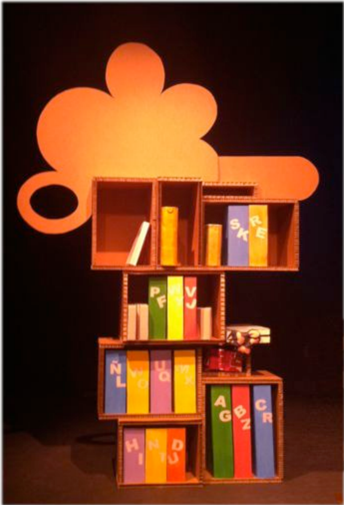
La Biblioteca: Un lugar para aprender